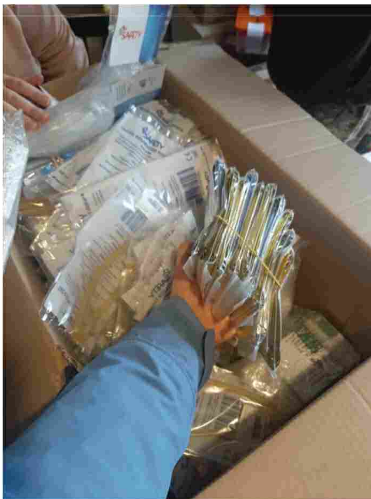
Alcuni dei farmaci rari raccolti

I dipendenti della Sangritana non rimanendo indifferenti al difficile momento della popolazione ucraina ed al conflitto che sta interessando l'est Europa hanno deciso di rendersi utili con una lodevole iniziativa. Grazie ad una generosa raccolta di fondi ed alla partnership con la Farmacia Visini , sono state infatti organizzate due spedizioni di farmaci rari da destinare alle sale operatorie ed ai reparti oncologici di Khmelnytskyi . Le spedizioni effettuate il 27 marzo e 3 aprile, sono state coordinate con l'associazione umanitaria "Хмельницький Армія SOS" che ha ringraziato pubblicamente sulle proprie pagine social la Sangritana per il valido supporto in questo difficile periodo.